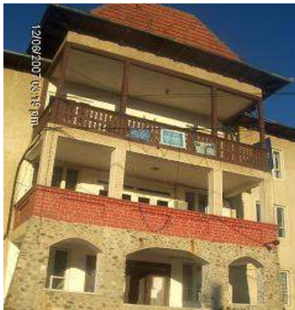
Sediul Consiliului local și al Primăriei Vaideeni

Dezvoltarea locală, în contextul actual al schimbărilor, al restructurării economice și administrative, trebuie să fie văzută ca un proces dependent de inovație și antreprenariat, sprijinit de mecanisme societale și structuri instituționale flexibile, cu un grad ridicat de cooperare și interacțiune locală și centrală.