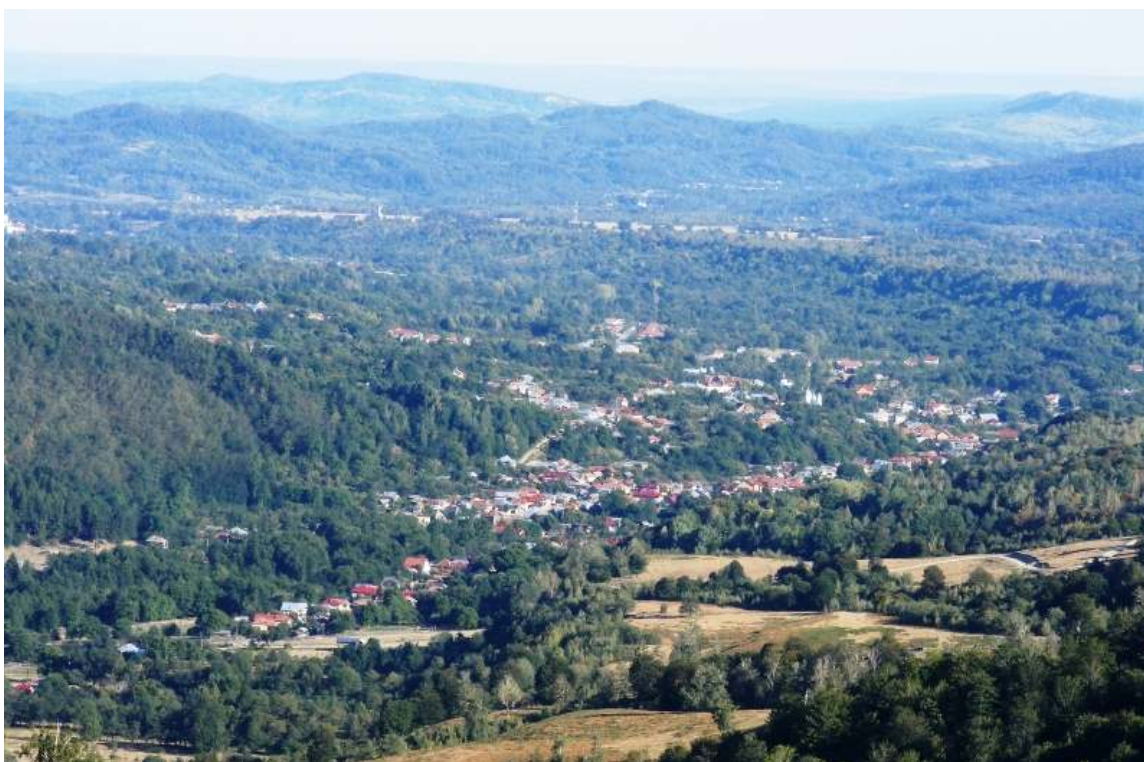
Vedere de ansamblu – sat Vaideeni

Prima atestare documentară a satului Vaideeni datează din secolul XIII, când este menționată sub numele de Vai de Ei . Comunitatea a luat naștere în urma venirii din Ardeal a mai multor familii de oieri, în principal din Mărginimea Sibiului pe motivul opririi religioase (catolicizare forțată). Din punct de vedere etnocultural, Vaideeni reprezintă o zonă de interferență între zona etnografică a Olteniei de sub Munte și zona etnografică Mărginimea Sibiului care și-a pus puternic amprenta asupra graiului, portului și tradiției pastorale .